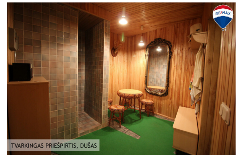
TVARKINGAS PRIEŠPIRTIS, DUŠAS