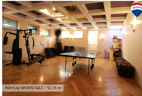
POKYLIŲ/SPORTO SALĖ | 53,15 m 2