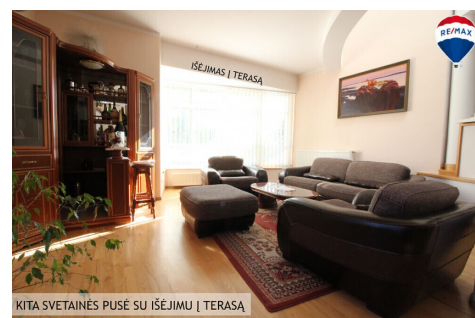
KITA SVETAINĖS PUSĖ SU IŠĖJIMU Į TERASĄ