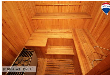
ĮRENGTA JAUKI PIRTĖLĖ