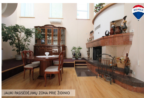
JAUKI PASISĖDĖJIMŲ ZONA PRIE ŽIDINIO