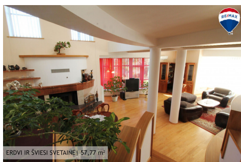
ERDVI IR ŠVIESI SVETAINĖ | 57,77 m 2