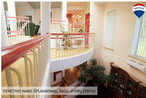
VIENITINIS NAMO ĮSIPLANAVIMAS, DAUG ATVIRŲ ERDVIŲ