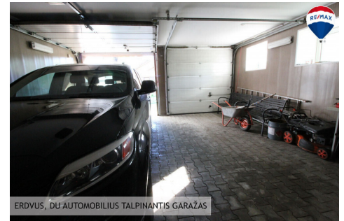
ERDVUS, DŪ AUTOMOBILIUS TALPINANTIS GARAŽAS