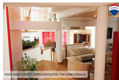
VISOS NAMO ERDVĖS SUPROJEKTUOTOS ITIN FUNKCIONALIAI