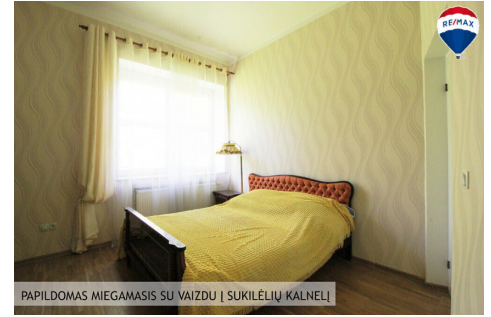
PAPILDOMAS MIEGAMASIS SU VAIZDU | SUKILĖLIŲ KALNELIŲ