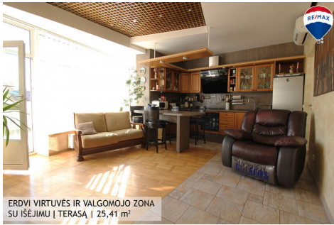
ERDVI VIRTUVĖS IR VALGOMOJO ZONA SU IŠĖJIMU Į TERASĄ | 25,41 m 2