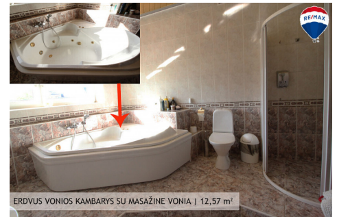
ERDVUS VONIOS KAMBARYS SU MASAŽINE VONIA | 12,57 m 2