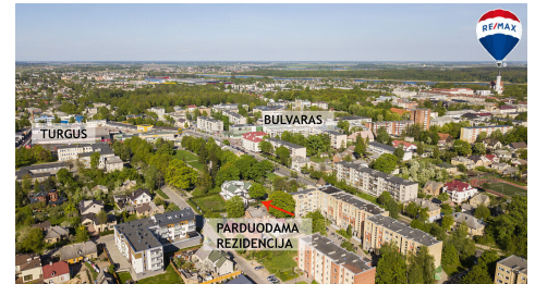
TURGUS BULVARAS PARDUODAMA REZIDENCJA