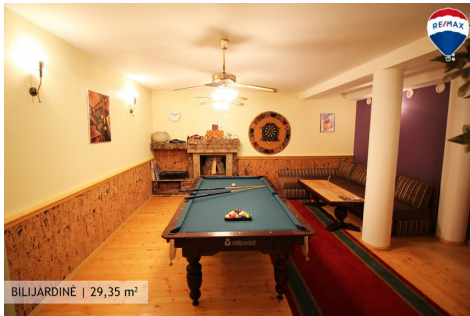
BILIJARDINĖ | 29,35 m 2