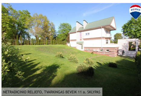
NETRADICINIO RELJEFO, TVARKINGAS BEVEIK 11 a. SKLYPAS