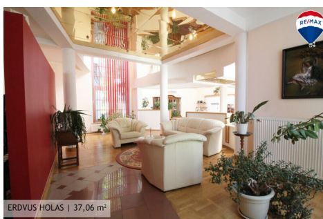
ERDVUS HOLAS | 37,06 m 2