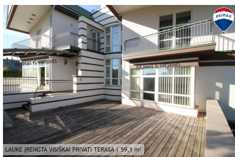
LAUKE ĮRENGTA VISIŠKAI PRIVATI TERASA | 59,1 m 2