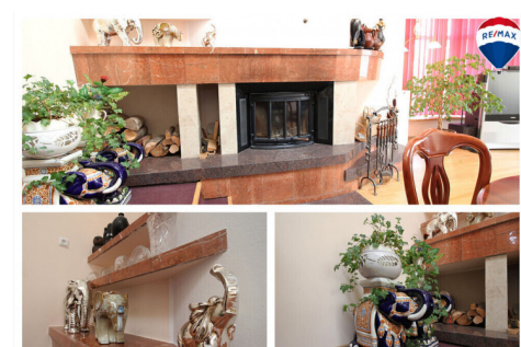
JAUKI ŽIDINIO ZONA