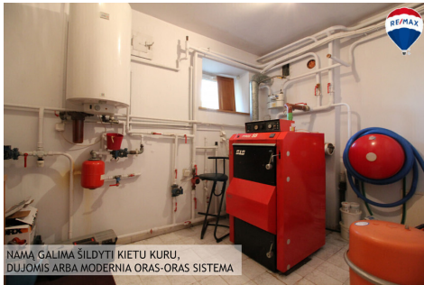
NAMA GALIMA ŠILDYTI KIETU KURU, DUJOMIS ARBA MODERNA ORAS-ORAS SISTEMA