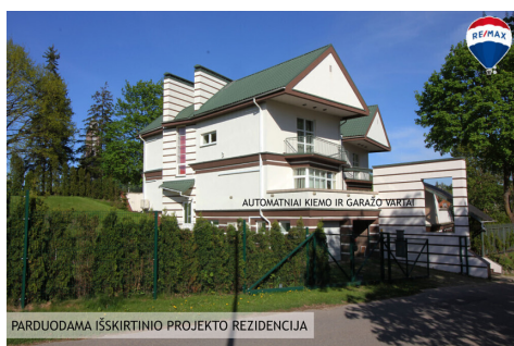
PARDUODAMA IŠSKIRTINIO PROJEKTO REZIDENCIJA

Susisiekti el.paštu: justas.niauronis@remax.lt