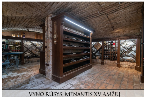
VYNO RŪSYS, MENANTIS XV AMŽIŲ