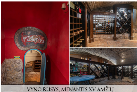
VYNO RŪSYS, MENANTIS XV AMŽIŲ