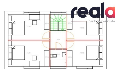
2 AUKŠTŲ PLANAS 59,15 M 2