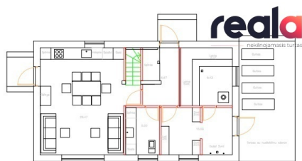
1 AUKŠTŲ PLANAS 60,98 M 2