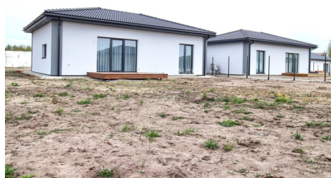
80 kv. m NAMŲ PLANAI