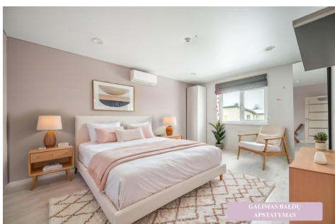
GALIMAS BALDŲ APSTATYMAS