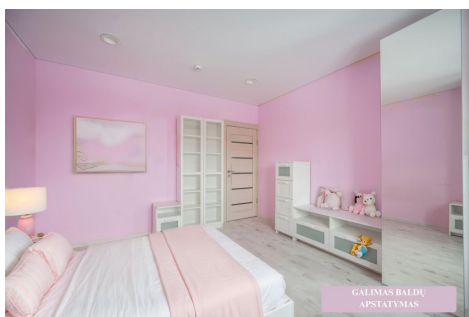
GALIMAS BALDŲ APSTATYMAS