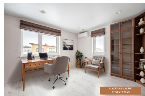
GALIMAS BALDŲ APSTATYMAS