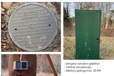
- Įrengtas vandens grežinys - Vietinė kanalizacija - Elektros galiosumas 20 kW