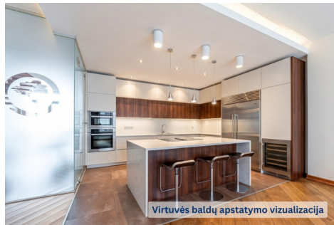
Virtuvės baldų apstatymo vizualizacija