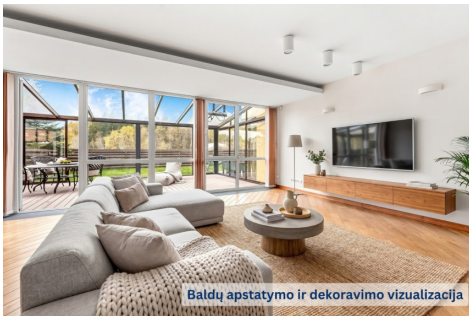
Baldų apstatymo ir dekoravimo vizualizacija