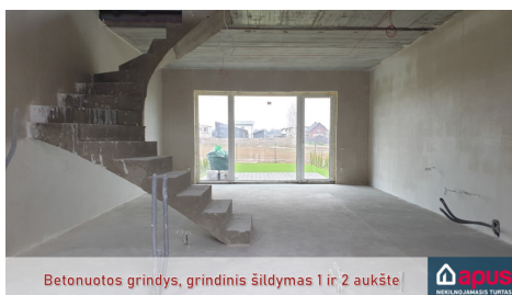
Betonuotos grindys, grindinis šildymas 1 ir 2 aukšte