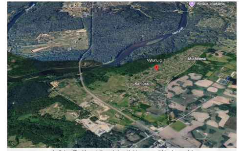
Aplink miškai ir netoliese tekantis Nemunas iki kurio vos 1 km