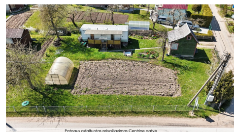
Patogus asfaltuotas privažavimas Centrine gatve