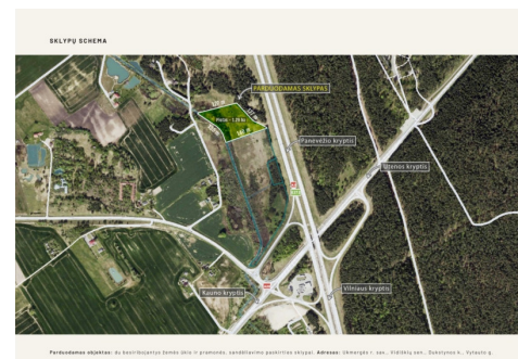
Parduodamas objektas: pramonės, sandėliavimo paskirties sklypas. Adresas: Ukmergės r. sav., Vidiklų sen., Dukstynos k., Vytauto g.