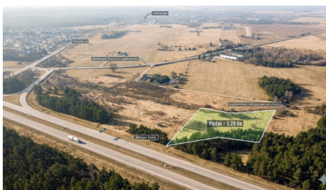
Parduodamas objektas: pramonės, sandėliavimo paskirties sklypas. Adresas: Ukmergės r. sav., Vidiklų sen., Dukstynos k., Vytauto g. 122B