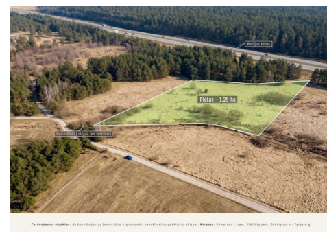
Parduodamas objektas: pramonės, sandėliavimo paskirties sklypas. Adresas: Ukmergės r. sav., Vidiklų sen., Dukstynos k., Vytauto g.