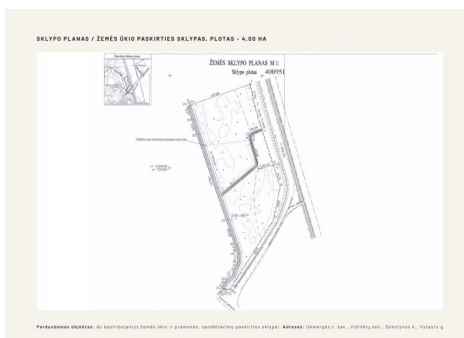
Parduodamas objektas: pramonės, sandėliavimo paskirties sklypas. Adresas: Ukmergės r. sav., Vidiklų sen., Dukstynos k., Vytauto g.