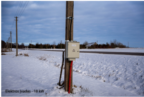
Elektros įvadas - 18 kW