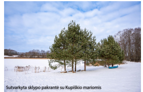
Sutvarkyta sklypo pakrantė su Kupiškio mariomis