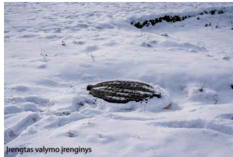
Įrengtas valymo įrenginys