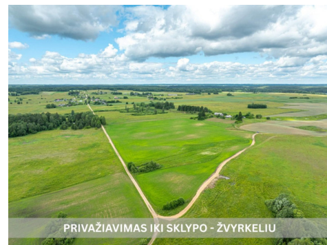
PRIVAŽIAVIMAS IKI SKLYPO - ŽVYRKELIU