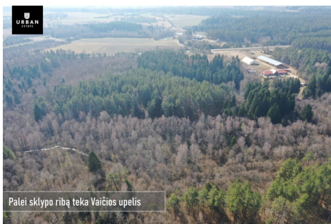
Palei sklypo ribą teka Vaičiūs upelis