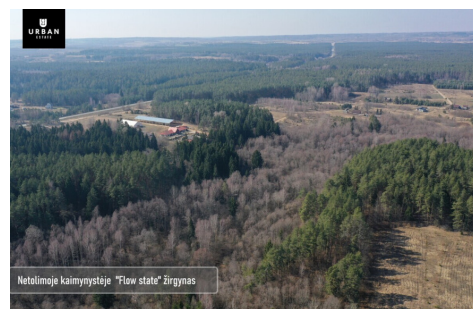
Netolimoje kaimynystėje "Flow state" žirgynas