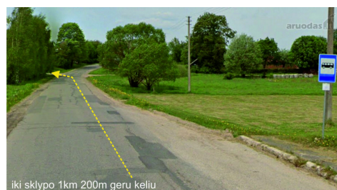
iki sklypo 1km 200m geru keliu