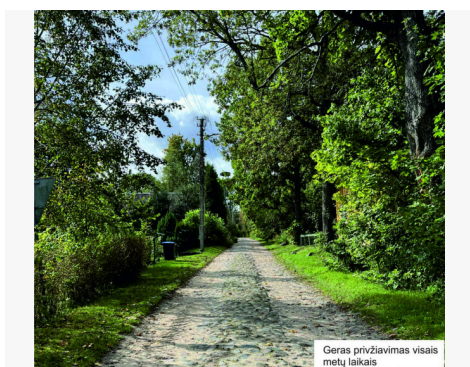
Geras privižinimas visais metų laikais