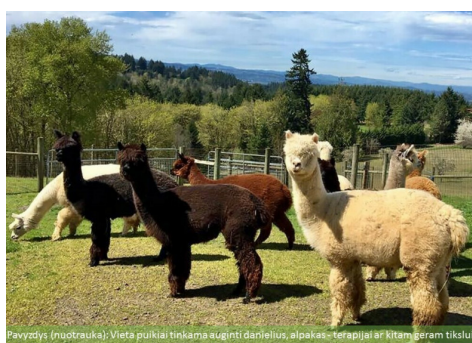
Pavyzdys (nuotrauka): Vietoje puikiai tinka auginti danielius, alpakas-terapijai ar kitam geram tikslui