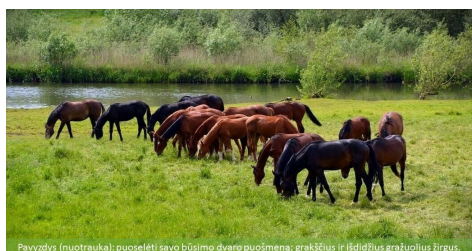
Pavyzdys (nuotrauka): puoseletė savo būsimo dvaro puošmena: graikiškus ir šilidžiūsus gražuolius žirgus.