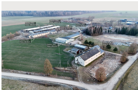
Pardodamas objektas: 6 pramonės / sandėliavimo / žemės ūkio pastatų, atitipai su juose esančiais pastatais. Adresas: Višniškų k., Ažuolų g. 12E, 12F, 12G, 12H