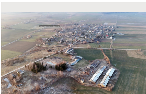
Pardodamas objektas: 6 pramonės / sandėliavimo / žemės ūkio pastatų, atitipai su juose esančiais pastatais. Adresas: Višniškų k., Ažuolų g. 12E, 12F, 12G, 12H