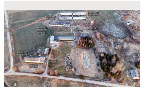
Pardodamas objektas: 6 pramonės / sandėliavimo / žemės ūkio pastatų, atitipai su juose esančiais pastatais. Adresas: Višniškų k., Ažuolų g. 12E, 12F, 12G, 12H