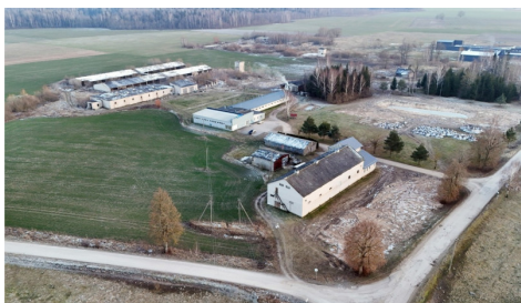
Pardodamas objektas: 6 pramonės / sandėliavimo / žemės ūkio pastatų, atitipai su juose esančiais pastatais. Adresas: Usmersgė r. sav., Taujėnų sen., Višniškų k., Ažuolų g. 12E, 12F, 12G, 12H

Susisiekti el.paštu: mindaugas.simelionis@capitalrealty.com