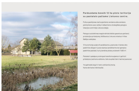
Pardodamas objektas: 6 pramonės / sandėliavimo / žemės ūkio pastatų, atitipai su juose esančiais pastatais. Adresas: Višniškų k., Ažuolų g. 12E, 12F, 12G, 12H