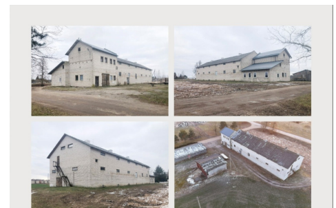
Pardodamas objektas: 6 pramonės / sandėliavimo / žemės ūkio pastatų, atitipai su juose esančiais pastatais. Adresas: Višniškų k., Ažuolų g. 12E, 12F, 12G, 12H