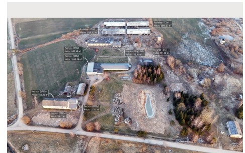
Pardodamas objektas: 6 pramonės / sandėliavimo / žemės ūkio pastatų sklypai su juose esančiais pastatais. Adresas: Višniūkių k., Ažuolų g. 12E, 12F, 12G, 12H