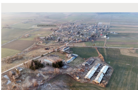
Pardodamas objektas: 6 pramonės / sandėliavimo / žemės ūkio pastatų sklypai su juose esančiais pastatais. Adresas: Višniūkių k., Ažuolų g. 12E, 12F, 12G, 12H