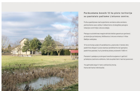
Pardodamas objektas: 6 pramonės / sandėliavimo / žemės ūkio pastatų sklypai su juose esančiais pastatais. Adresas: Višniūkių k., Ažuolų g. 12E, 12F, 12G, 12H