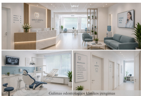
Galimas odontologijas klinikas iřengimas