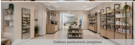
Galimas parduotuvės iřengimas