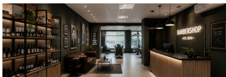
Galimas barbershop'o iřengimas