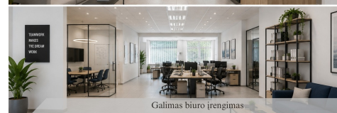
Galimas biuro iřengimas