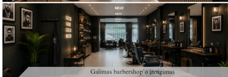
Galimas barbershop'o iřengimas