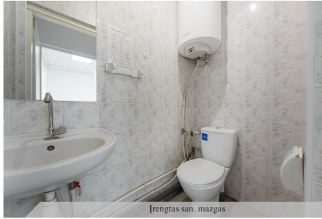
Iřengtas san. mazgas