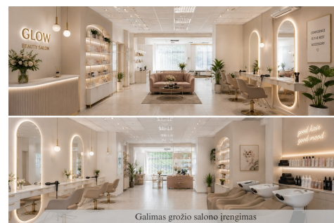
Galimas grožio salono iřengimas