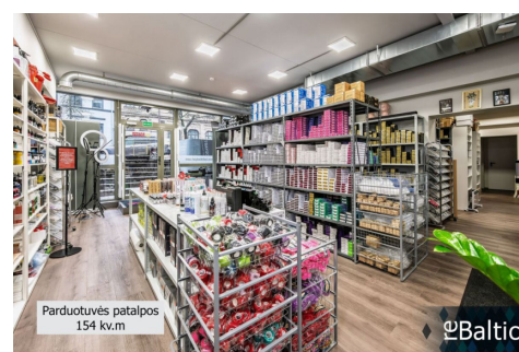
Parduotuvės patalpos 154 kv.m