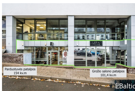
Parduotuvės patalpos 154 kv.m