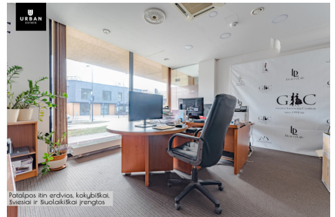
Patalpos itin erdvios, kokybiškai šviesios ir šiuolaikiškai įrengtos.