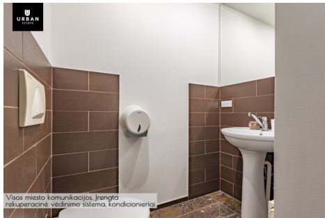
Visos miesto komunikacija, įrengta rekuperacinė vėdinimo sistema, kondicionieriai