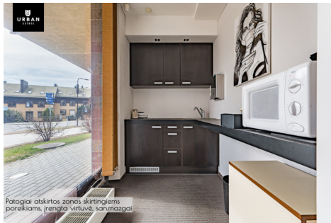
Patalpai atskirtos zonos skirtingiems poreikiams, įrengta virtuvė, san.mazgai.