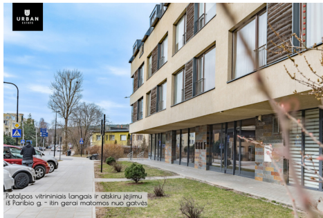
Patalpos vitrininiai langai ir atkuru jėjmu iš Fartbio g. - itin gerai matomas nuo gatvės.