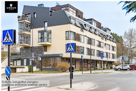
Erdvios, kokybiškai įrengtas patalpos pobūmė spašios centre